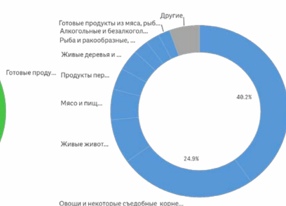
Структура импорта продукции АПК, млн долл. США