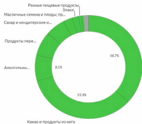
Структура экспорта продукции АПК, млн долл. США